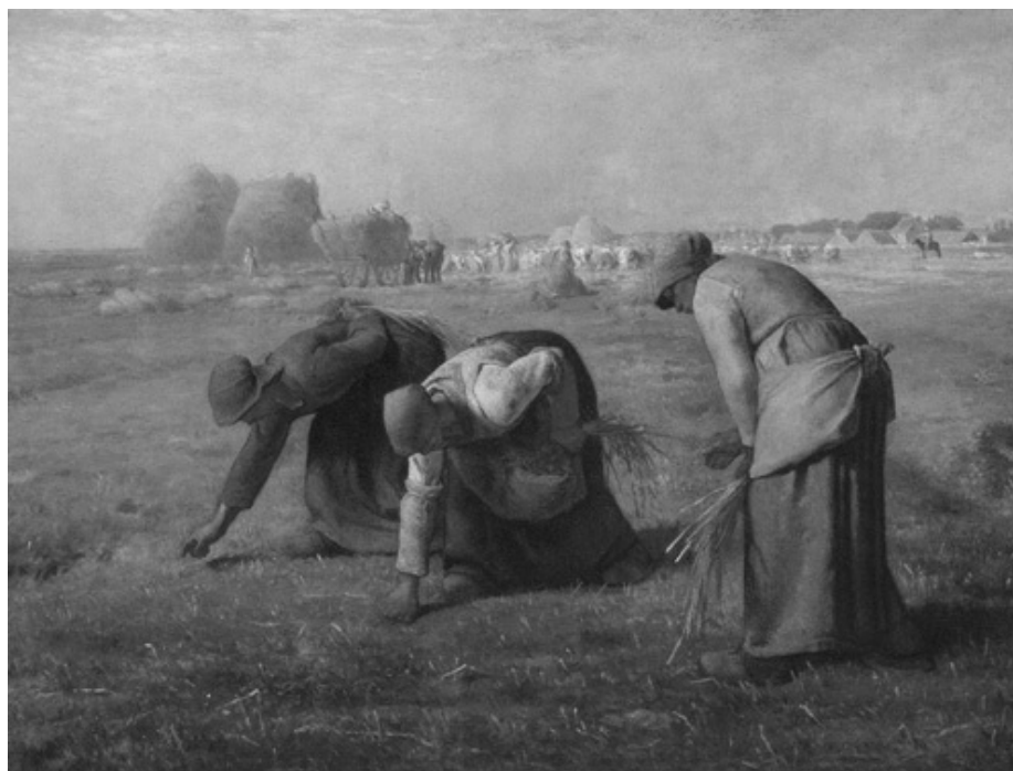
FIGURA 1 – The Gleaners, 1857, por Jean-François Millet (1814-1875)

As entrevistadas analisam a imigração, visto que a maioria dos trabalhadores (homens e mulheres) é de outros estados, justificando que mulheres e homens da cidade não têm capacidade (disposição) para realizar o trabalho nos